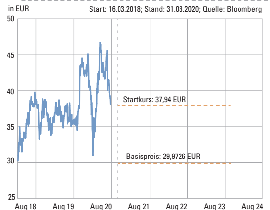
Frühere Wertentwicklungen sind kein verlässlicher Indikator für künftige Wertentwicklungen.