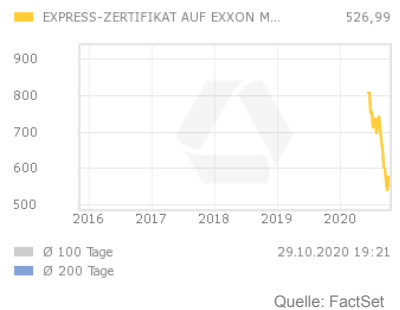
Chart 5 Jahre

Die maximale Laufzeit des Zertifikates beträgt vier Jahre. Das Startniveau entspricht dem Schlusskurs der Basiswert-Aktie am Ausgabetag. Die Barriere wird unterhalb des Startniveaus festgelegt und kommt am Laufzeitende zum Tragen, sofern das Zertifikat nicht vorzeitig zurückgezahlt wurde.