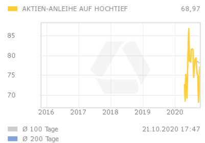
Chart 5 Jahre

Die Aktienanleihe bezahlt am Ende der Laufzeit einen festgelegten Kupon. Die Zahlung des Kupons ist dabei an keine Bedingung geknüpft und erfolgt in jedem Fall. Am Ausgabetag wird der Kurs der Basiswert-Aktie als Ausgangswert festgelegt. Der Basispreis wird prozentual ausgehend vom Ausgangswert festgelegt. Sofern die Aktie bei Fälligkeit der Aktienanleihe auf