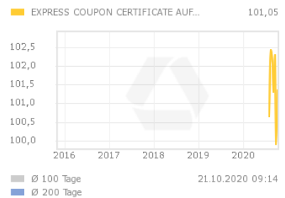
Chart 5 Jahre