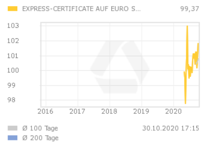
Chart 5 Jahre