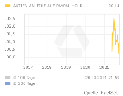
Chart 5 Jahre

Die Aktienanleihe bezahlt am Ende der Laufzeit einen festgelegten Kupon. Die Zahlung des Kupons ist dabei an keine Bedingung geknüpft und erfolgt in jedem Fall.