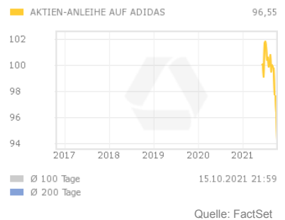
Chart 5 Jahre

Die Aktienanleihe bezahlt am Ende der Laufzeit einen festgelegten Kupon. Die Zahlung des Kupons ist dabei an keine Bedingung geknüpft und erfolgt in jedem Fall. Am Ausgabebetag wird der Kurs der Basiswert-Aktie als Ausgangswert festgelegt. Der Basispreis wird prozentual ausgehend vom Ausgangswert festgelegt. Sofern die Aktie bei Fälligkeit der Aktienanleihe auf