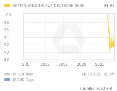
Chart 5 Jahre