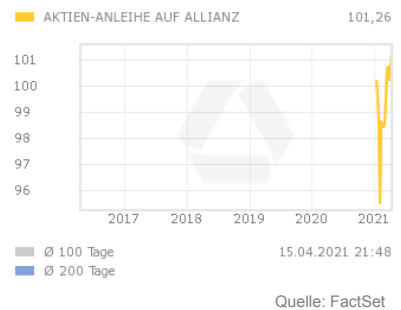
Chart 5 Jahre