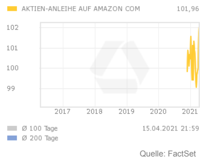
Chart 5 Jahre

Die Aktienanleihe bezahlt am Ende der Laufzeit einen festgelegten Kupon. Die Zahlung des Kupons ist dabei an keine Bedingung geknüpft und erfolgt in jedem Fall.