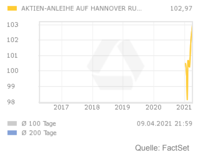
Chart 5 Jahre