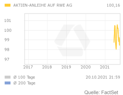
Chart 5 Jahre