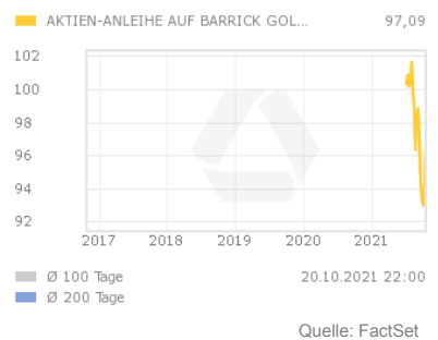
Chart 5 Jahre

Die Aktienanleihe bezahlt am Ende der Laufzeit einen festgelegten Kupon. Die Zahlung des Kupons ist dabei an keine Bedingung geknüpft und erfolgt in jedem Fall.