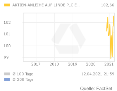
Chart 5 Jahre