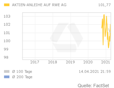
Chart 5 Jahre