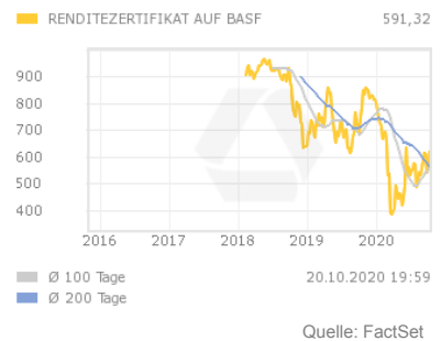
Chart 5 Jahre

Die maximale Laufzeit des Zertifikates beträgt vier Jahre. Das Startniveau entspricht dem Schlusskurs der Basiswert-Aktie am Ausgabetag. Notiert der Schlusskurs der Basiswert-Aktie am jährlichen Bewertungstag auf oder oberhalb der Barriere, wird an jedem Ausschüttungstermin eine fixe Ausschüttung gezahlt. Ist an einem der ersten drei Bewertungstage die