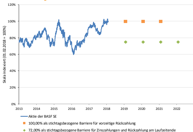
Angaben zur bisherigen Wertentwicklung erlauben keine Prognosen für die Zukunft.