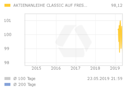
Chart 5 Jahre

Die Aktienanleihe bezahlt am Ende der Laufzeit einen festgelegten Kupon. Die Zahlung des Kupons ist dabei an keine Bedingung geknüpft und erfolgt in jedem Fall. Am Ausgabetag wird der Kurs der Basiswert-Aktie als Ausgangswert festgelegt. Der Basispreis wird prozentual ausgehend vom Ausgangswert festgelegt. Sofern die Aktie bei Fälligkeit der Aktienanleihe auf