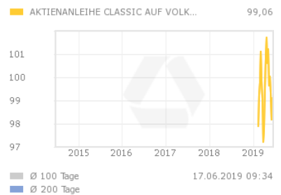
Chart 5 Jahre

Die Aktienanleihe bezahlt am Ende der Laufzeit einen festgelegten Kupon. Die Zahlung des Kupons ist dabei an keine Bedingung geknüpft und erfolgt in jedem Fall. Am Ausgabetag wird der Kurs der Basiswert-Aktie als Ausgangswert festgelegt. Der Basispreis wird prozentual ausgehend vom Ausgangswert festgelegt. Sofern die Aktie bei Fälligkeit der Aktienanleihe auf