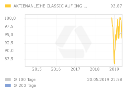
Chart 5 Jahre

Die Aktienanleihe bezahlt am Ende der Laufzeit einen festgelegten Kupon. Die Zahlung des Kupons ist dabei an keine Bedingung geknüpft und erfolgt in jedem Fall. Am Ausgabetag wird der Kurs der Basiswert-Aktie als Ausgangswert festgelegt. Der Basispreis wird prozentual ausgehend vom Ausgangswert festgelegt. Sofern die Aktie bei Fälligkeit der Aktienanleihe auf