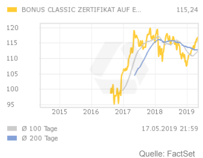
Chart 5 Jahre

Das Zertifikat zahlt am Ende der Laufzeit den aktuellen Indexstand des EURO STOXX 50 Preisindex multipliziert mit dem Bezugsverhältnis aus. Sofern der Index niemals während der Laufzeit die Barriere unterschreitet bzw. erreicht, wird am Laufzeitende mindestens der definierte Bonus