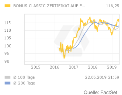
Chart 5 Jahre

Das Zertifikat zahlt am Ende der Laufzeit den aktuellen Indexstand des EURO STOXX 50 Preisindex multipliziert mit dem Bezugsverhältnis aus. Sofern der Index niemals während der Laufzeit die Barriere unterschreitet bzw. erreicht, wird am Laufzeitende mindestens der definierte Bonus