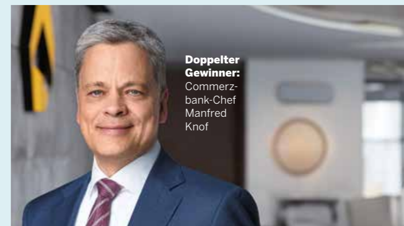
Doppelter Gewinner: Commerzbank-Chef Manfred Knof

Der Bankentest dokumentiert den Wiederaufstieg: Die Commerzbank verteidigt erneut ihre Spitzenstellung unter den bundesweiten Filialbanken