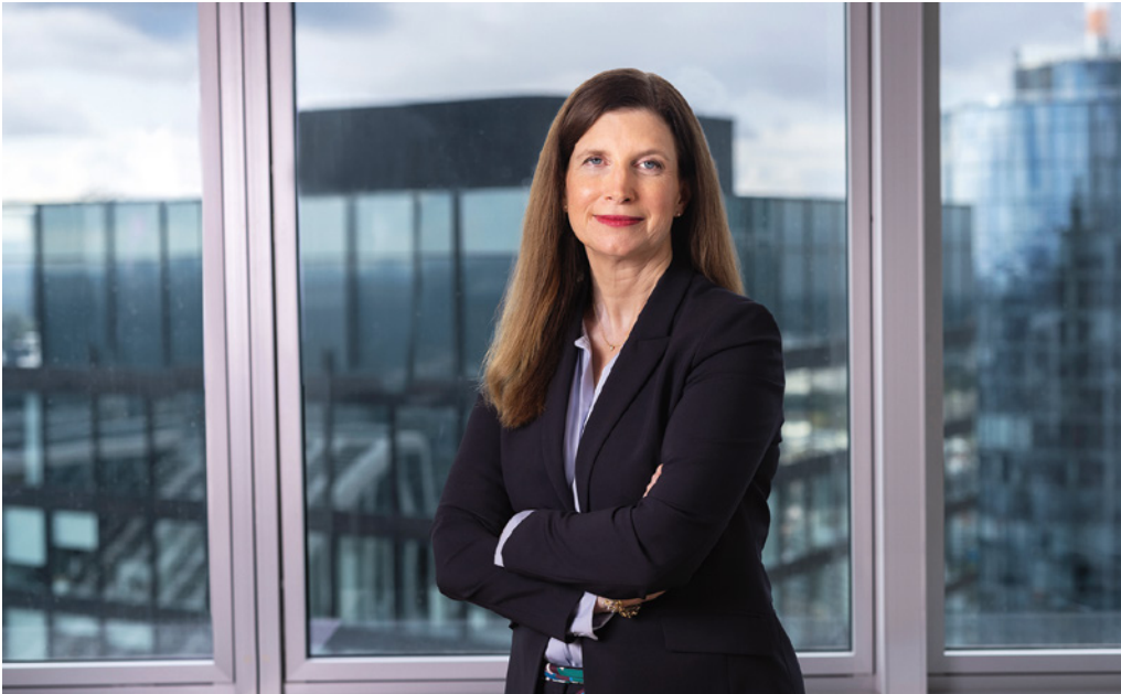
Ganz oben im Bankenturm: Neue Commerzbank-Chefin Bettina Orlopp