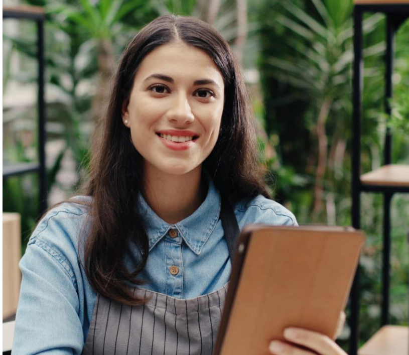
Privat- und Unternehmerkunden

Mit einem kundenfokussierten Portfolio an Finanzdienstleistungen ist die Commerzbank in Deutschland die führende Bank im Firmenkundengeschäft und für den Mittelstand sowie starke Partnerin von Privat- und Unternehmerkundinnen und -kunden mit einem angelegten Vermögen von mehr als 400 Mrd. Euro .