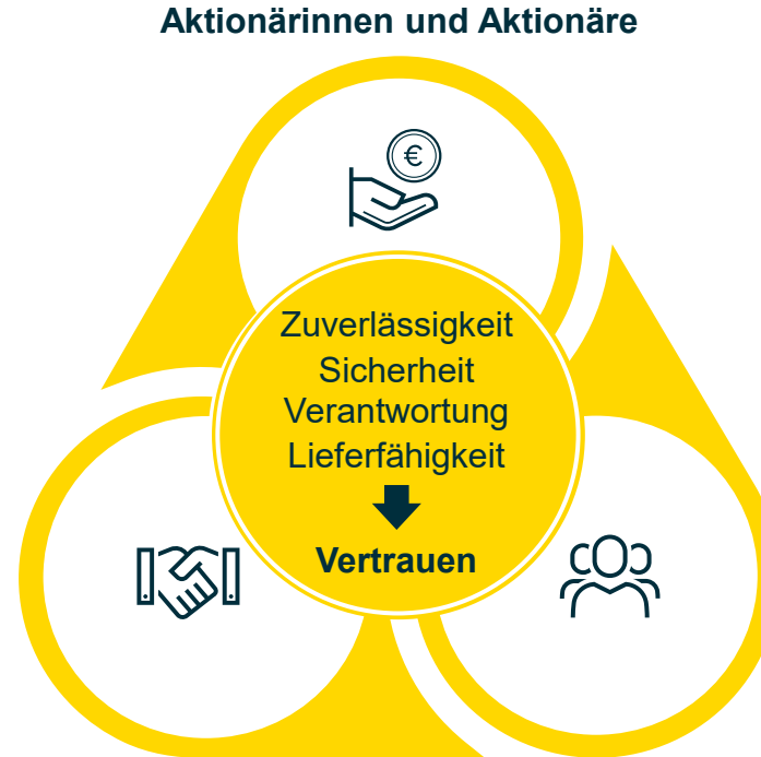
Kundinnen und Kunden Mitarbeitende