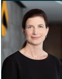
Bettina Orlopp Vorsitzende