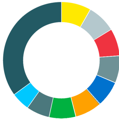
Struktur nach Top Holdings