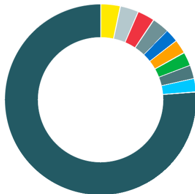
Struktur nach Top Holdings